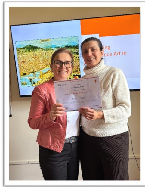
Képek a tanórákról...